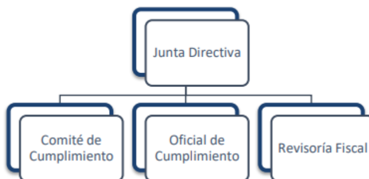
Gráfico No. 1. Organigrama PTEE

La estructura organizacional del PTEE será la siguiente: